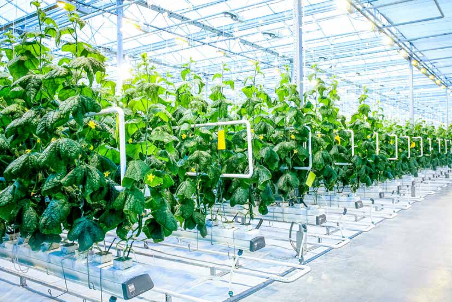
PRZYKŁADOWE ZASTOSOWANIE - SZKLARNIA