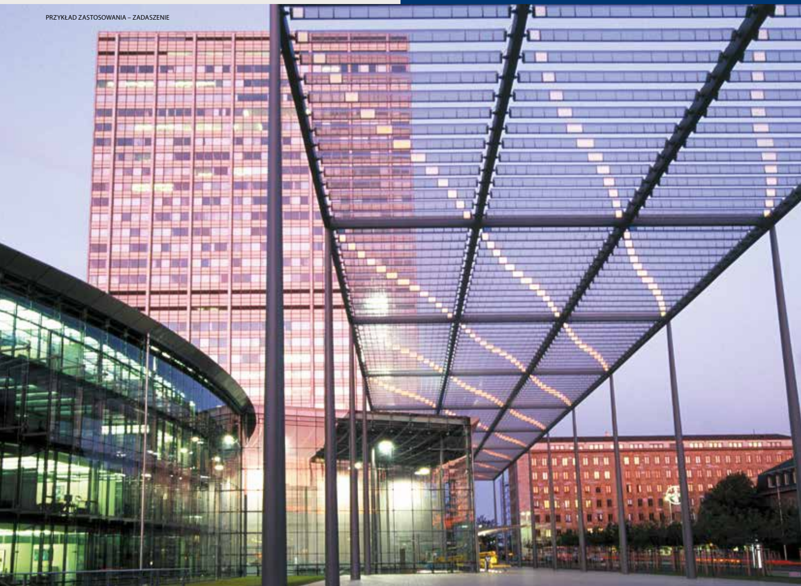
PRZYKŁAD ZASTOSOWANIA – ZADASZENIE